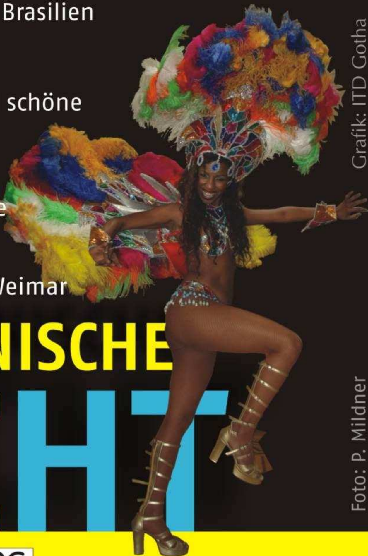
Grafik: ITD Gotha